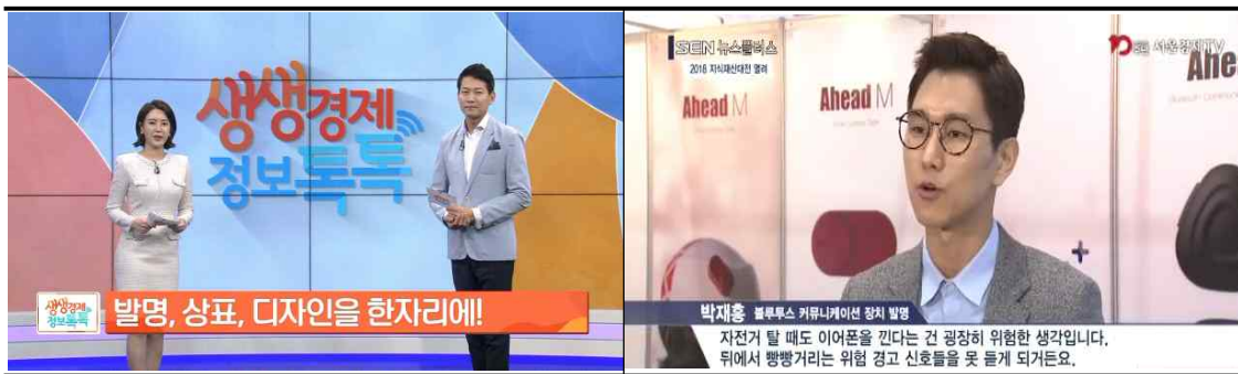
주요 매체 홍보 및 수상자 인터뷰(예시)